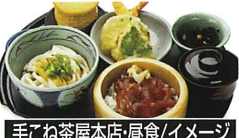
手こね茶屋本店・昼食/イメージ