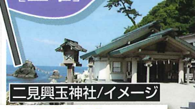
二見興玉神社/イメージ