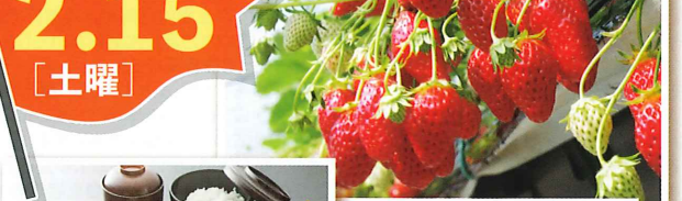
いちご狩り/イメージ