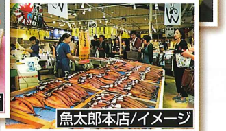
魚太郎本店/イメージ