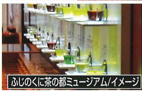
ふじのくに茶の都ミュージアム/イメージ