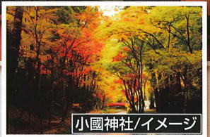
小國神社/イメージ