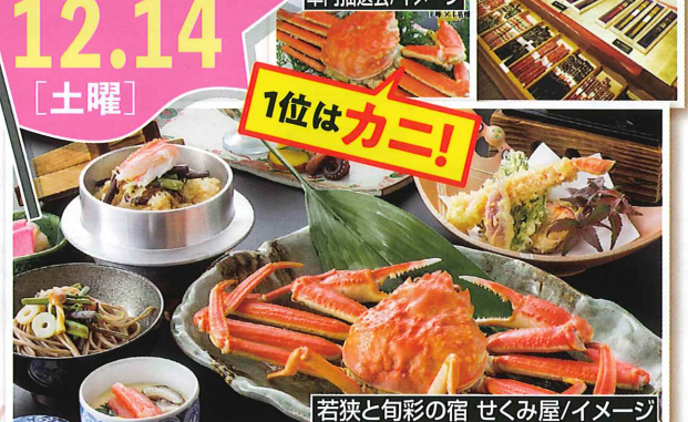
簗匠せいわ/イメージ