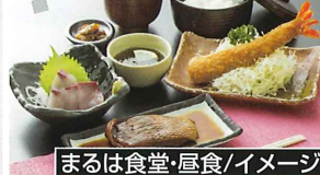
まるは食堂・昼食/イメージ