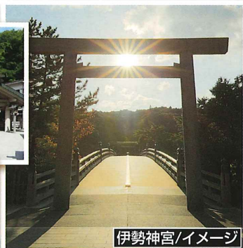
伊勢神宮/イメージ